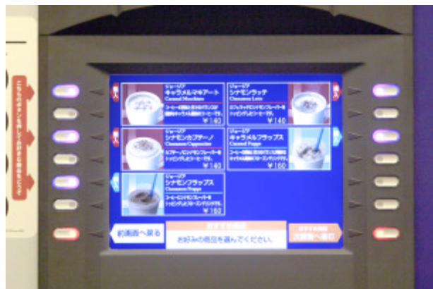
液晶画面：メニューが表示された液晶パネル