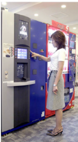
ジョージア カフェマティックの利用風景