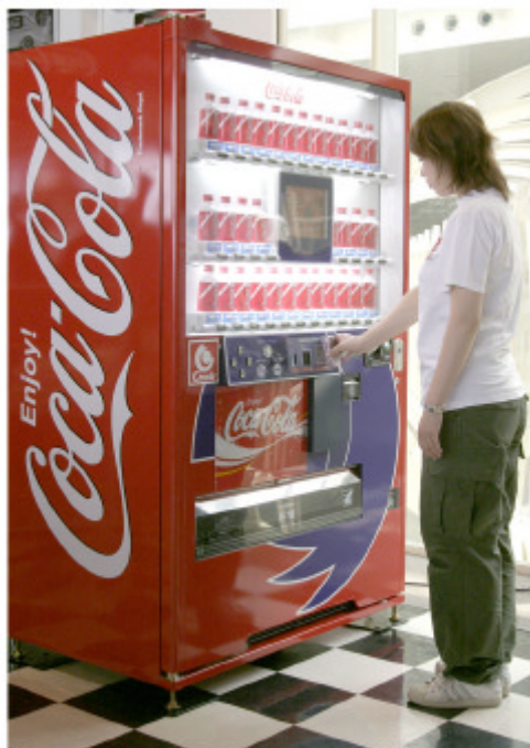
シーモ2の利用風景