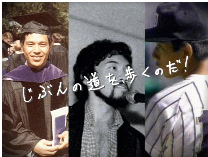
「ジョージア」新TV-CM「立ち上がり」篇より